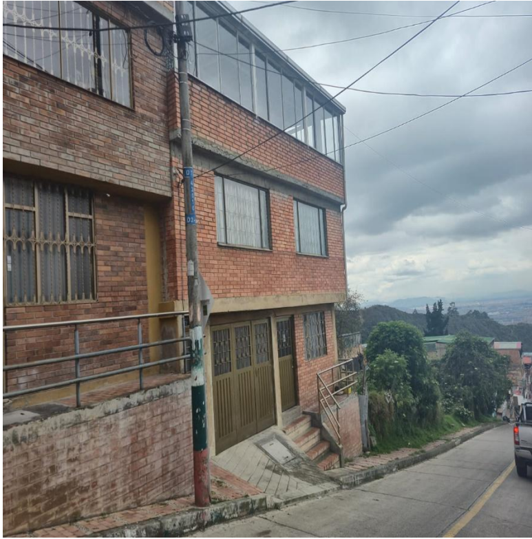
IMAGEN 3: FACHADA LATERAL