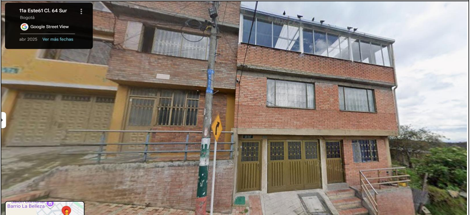
IMAGEN 1: NOMENCLATURA